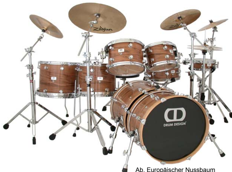
Ab. Europäischer Nussbaum